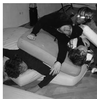
In vielen lokalen Allianzgemeinden lebten Jugendliche während einer Woche in der Kirche.

Im Begleittext zur Allianzgebetswoche wurde die Idee von Homecamps gegeben: Junge Menschen verschiedener Allianzgemeinden