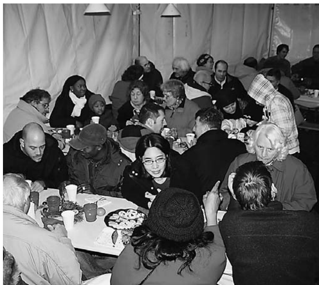
Gemeinsame Anlässe stärken die lokalen Allianzen: Strasseneinsatz an Weihnachten in Basel.

te Beziehungen der Gemeindeleiter voraus – man nimmt sich Zeit füreinander und man setzt sich füreinander ein. Zweitens: Beziehungen an der Basis wachsen durch interne oder externe Aktionen, in denen man auf ein Miteinander angewiesen ist.