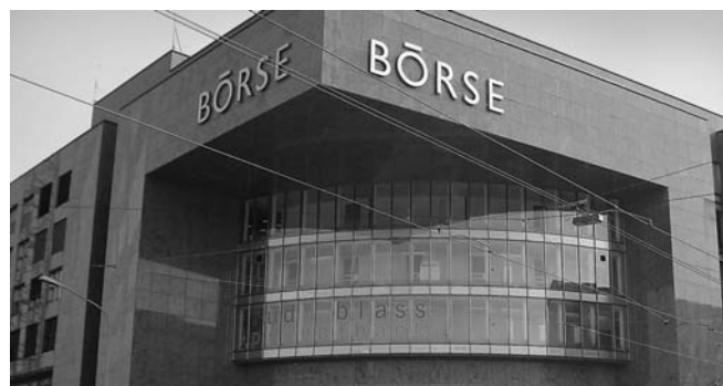
Weltweite Finanzkrise: Die SEA reagierte Ende 2008 mit Vorbereitungen für eine Stellungnahme.

Im Herbst des Jahres 2008 werden zwei Themen besonders aktuell. Zum einen ist es die weltweite Finanzkrise, welche sich zu einer allgemeinen Wirtschaftskrise ausweitete. Die SEA reagiert früh und beginnt mit den Vorbereitungen einer Stellungnahme, welche an ethisch-christliche Werte erinnern und das solidarische Handeln fördern soll. Zum zweiten ist es die Abstimmung über die Schweizerische Drogenpolitik am 30. November. Die Hanfinitiative (Legalisierung von Cannabis-Konsum) setzt nach Ansicht der SEA falsche Signale. Sie lehnt die Initiative ab. Das revidierte Betäubungsmittelgesetz dagegen ist umstrittener. Vor allem wegen der Regelung zur Abgabe therapeutischer Substanzen sind sich auch christliche Suchtexperten uneinig. Die SEA zeigt Pro- und Kontraargumente auf.