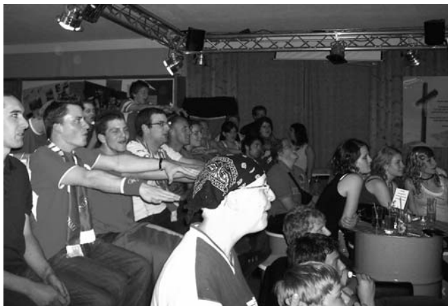
Fussballbegeisterte am Public Viewing der FEG Sirnach.

Hilfreich in der Begegnung und im Gespräch mit den Menschen waren die verschiedenen evangelistischen Verteilprodukte, wie das Lukas-Evangelium «Tor zum Himmel», die Fussball-DVD oder die Give-Aways für Kinder. Dies ergab eine Umfrage, welche Kickoff2008 im Anschluss an die Euro08 bei allen Veranstaltern durchführte. Was die Befragung ebenfalls ausdrückt: Ein Viertel aller Besucherinnen und Besucher waren kirchendistanzierte Menschen, die den Schritt durch eine Kirchentüre oder in eine christliche Umgebung wagten. Diese Zahl freut Kickoff2008 ganz speziell und macht deutlich, dass das evangelistische Potenzial dieses Fussball-Highlights genutzt werden konnte. Und schliesslich macht eine nicht