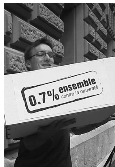
Am 26. Mai 2008 wurden 201'679 Unterschriften für die Petition «0,7% – Gemeinsam gegen Armut» an die schweizerische Behörde übergeben.

Im Februar setzte sich die Arbeitsgemeinschaft Religionsfreiheit (AGR) der SEA für algerische Christen ein, die zu einer mehrjährigen Haftstrafe verurteilt wurden. Die AGR/SEA intervenierte mit einem Brief an den Botschafter Algeriens in Bern, in dem sie dagegen protestierte, dass die Urteile ohne Anhörung der Angeklagten gefällt worden waren. Auch Bundesrätin Micheline Calmy Rey erhielt von der Arbeitsgemeinschaft für Religionsfreiheit einen Brief mit der Bitte, sich für die