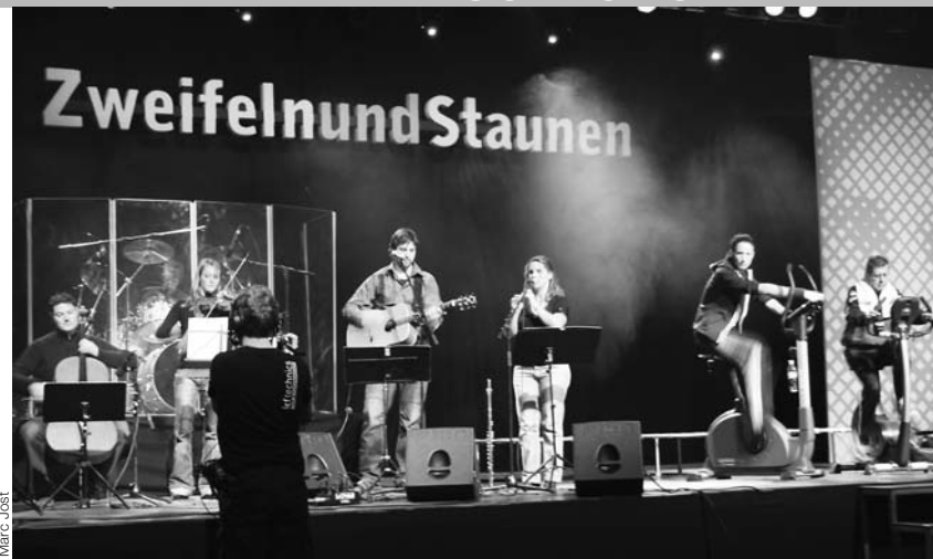
Gut besucht: die Veranstaltung ProChrist in Thun.

Leitung von Netzwerkbasel den Passanten auf dem Claraplatz in kreativer Art das Evangelium weitergaben. Eine Umfrage unter unseren Gemeinden und Werken hat gezeigt, dass die Vorstellungen über die Methode der Evangelisation sehr unterschiedlich sind. Wir sind überzeugt, dass es vielfältige Wege braucht, um das Evangelium zu den Menschen zu bringen: meist hat es etwas mit Freundschaft und Beziehung zu Nichtchristen zu tun. So gibt es Gemeinden, die das Evan-