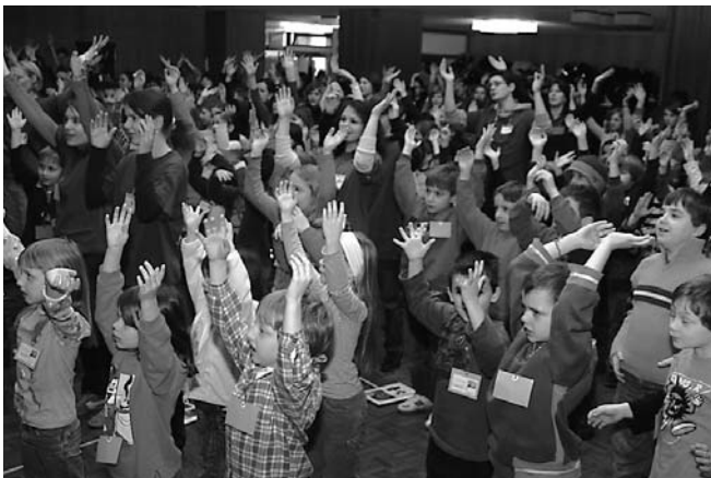
Über 300 junge Gäste nahmen an der Kinderwoche der Allianz Riehen-Bettingen zum Thema «Stern von Persien» teil.

In einem Schulhaus in Riehen wurde von 90 Mitarbeitenden ein vielseitiges Programm geboten, das den Kindern auf kreative Art und Weise zeigte, wie die biblischen Geschichten mit ihrem eigenen Alltag zusammenhängen. An einem Nachmittag wurden in diesem Jahr neu 16 verschiedene Workshops angeboten. Die Kinder bauten Legoburgen unter Wasser, besuchten Workshops in Taekwondo, beteiligten sich an einer Schatzsuche oder einem Tarzanparcours. Zum Mittagessen gab es die beliebten Hot Dogs – für das Verpflegungsteam war es eine Herausforderung, 400 hungrige Mäuler mit 800 Brötchen und Würsten in kurzer Zeit zu versorgen.