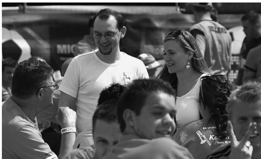
Eine von vielen Aktionen anlässlich der Euro 08: Strasseneinsatz in Bern.

Kickoff2008 war eine Initiative von Christinnen und Christen aus Kirchen, Werken und christlichen Sportlerorganisationen anlässlich der Fussball-Euro 08. Trägerorganisation war die Schweizerische Evangelische Allianz, unterstützt durch Operation Mobilisation (OM), Athletes in Action (AiA) und SRS pro Sportler.