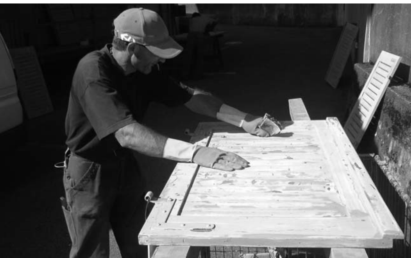
Die Stiftung Wetterbaum in Frauenfeld schult und betreut Sozialhilfebezügler, um sie wieder in die Arbeitswelt und Gesellschaft zu integrieren.

Auch im Jahr 2008 setzte sich die SEA für gesellschaftliche Werte ein: Jugendalkoholismus, Finanzkrise, Minarette und Betäubungsmittel waren einige der Themen, die uns beschäftigten. Im Frühling 2008 äussert sich die SEA nochmals zum Thema Stop-Aids-Kampagne. Die Kampagnen des Bundesamtes seien inzwischen unverhältnismässig und vermitteln eine falsche Botschaft. Stattdessen solle sich der Bund stärker der Suizid-Prävention annehmen, die 20 Mal mehr Todesopfer fordere als HIV.