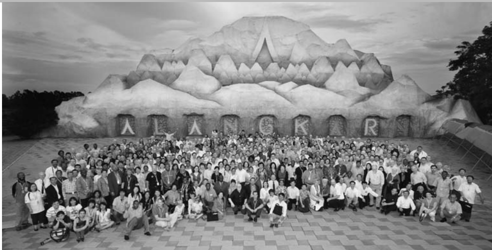
Die 500 Delegierten der WEA an der Weltkonferenz in Pattaya, Thailand.