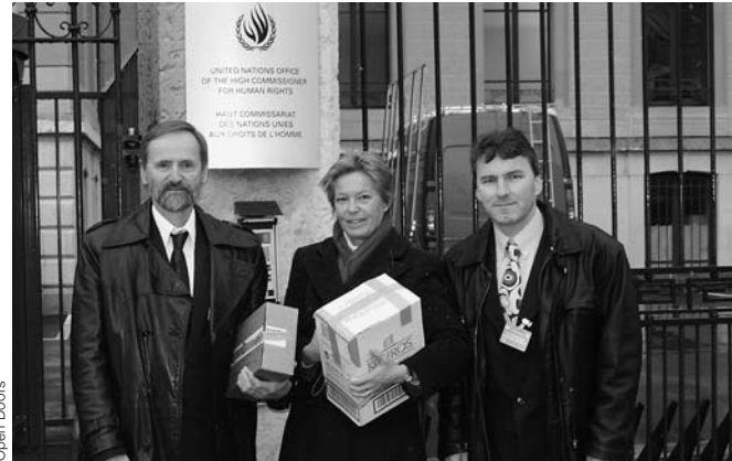
Vertreter der AGR übergeben in Genf eine Petition, die Religionsfreiheit für alle Menschen fordert.

berichterstatlerin der UNO für Religionsfreiheit, in Genf übergeben. Ebenfalls zum 60-Jahre Jubiläum der Menschenrechtserklärung stand das Forum für Religionsfreiheit, das am 7. Dezember in Bern stattfand. An einem Podiumsgespräch diskutierten Experten verschiedener Organisationen und des Bundes zum Thema Religionsfreiheit. Anwesend war ein in Deutschland lebender Ex-Muslim, der wegen seines Glaubenswechsels bedroht wird. Mit dem Präsidenten der Koordination Islamischer Organisationen Schweiz (Kios) Farhad Afshar wurde auch die Sicht der Muslime zu diesem Thema eingebracht. Am Tag anwesend war ebenfalls der Kanadier Geoff Tunnicliffe, Generaldirektor der Weltweiten Evangelischen Allianz, der die internationale Sicht der Evangelischen Allianz in dieser Frage darstellte. Tunnicliffe zeigte auf, dass die Missachtung der Religionsfreiheit in rund 50 Ländern oft vielschichtige Gründe hat.